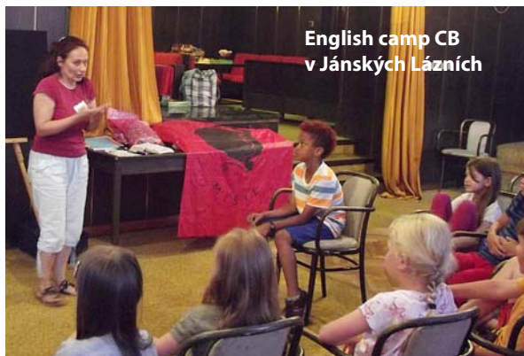
English camp CB v Jánských Lázních