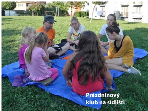
Prázdninový klub na sídlišti