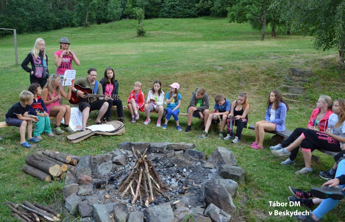
Tábor DM v Beskydech