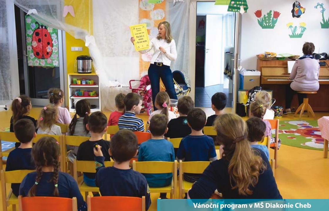
Vánoční program v MŠ Diakonie Cheb