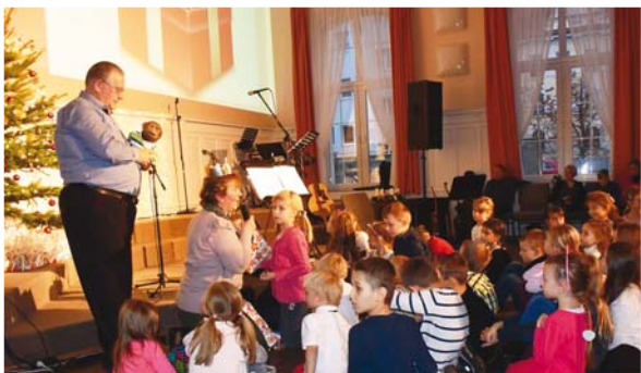
Vánoční program v CB Plzeň