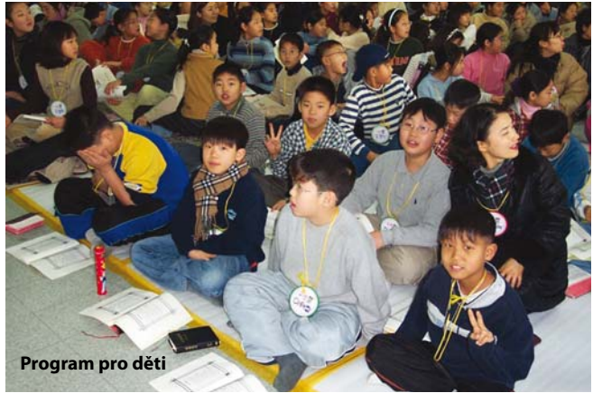
Program pro děti