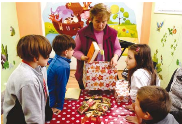
Vánoční klub v Kynšperku nad Ohří