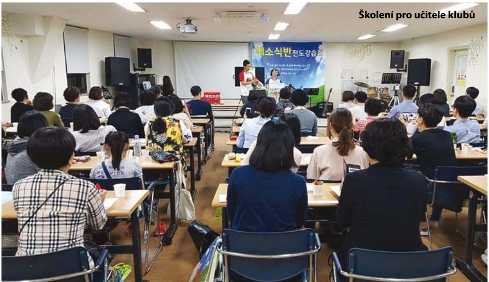
Školení pro učitele klubů