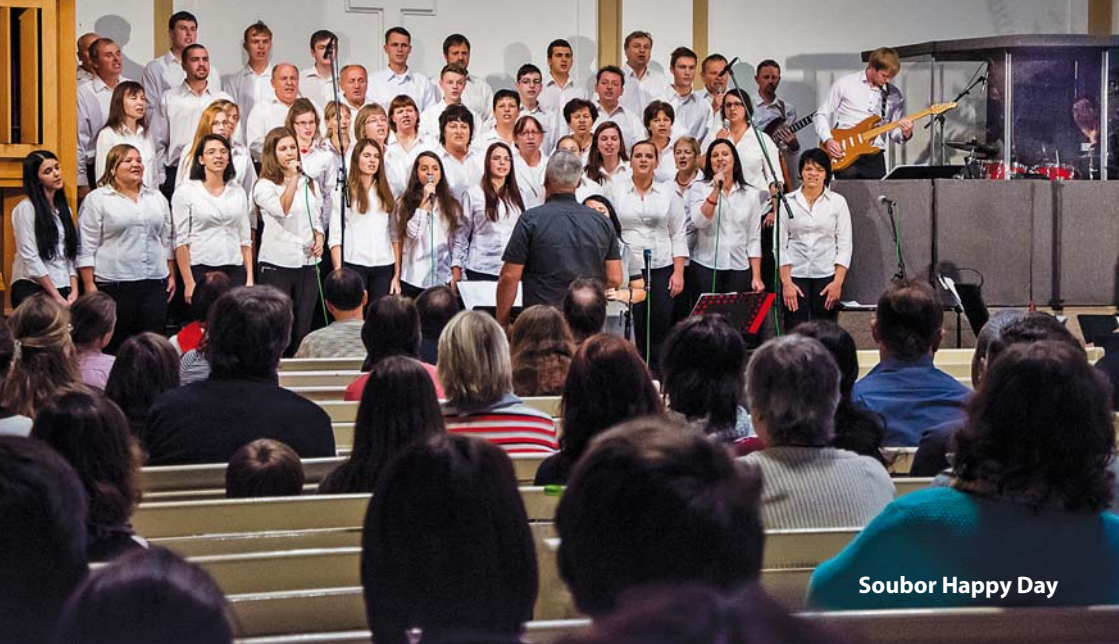
Soubor Happy Day