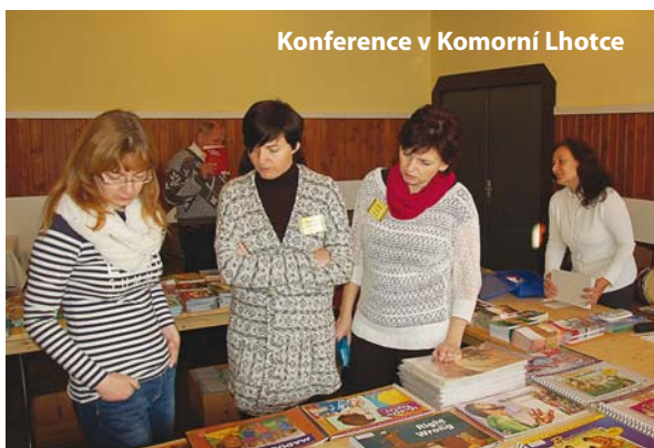
Konference v Komorní Lhotce