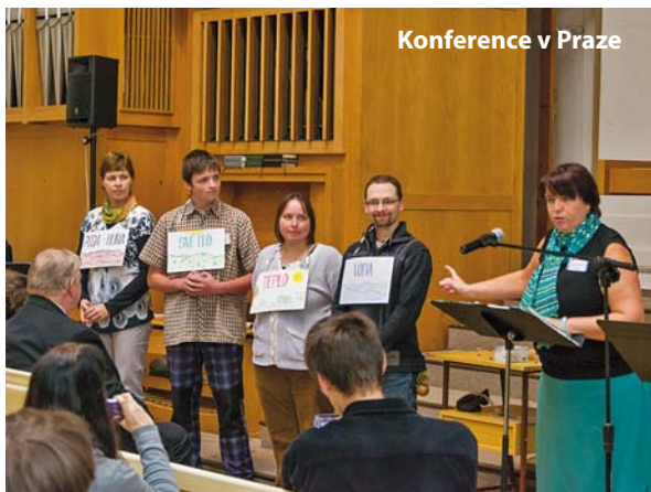
Konference v Praze