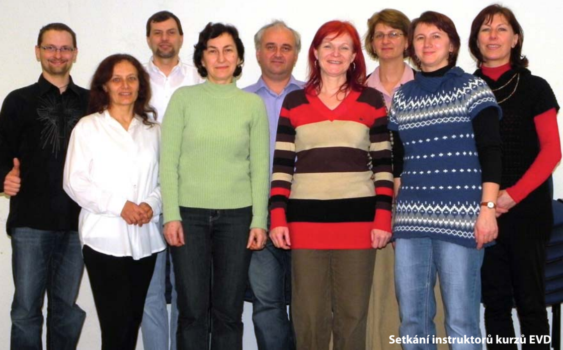
Setkání instruktorů kurzů EVD