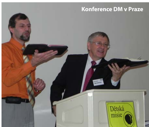
Konference DM v Praze