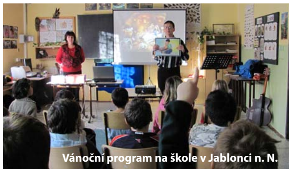
Vánoční program na škole v Jablonci n. N.