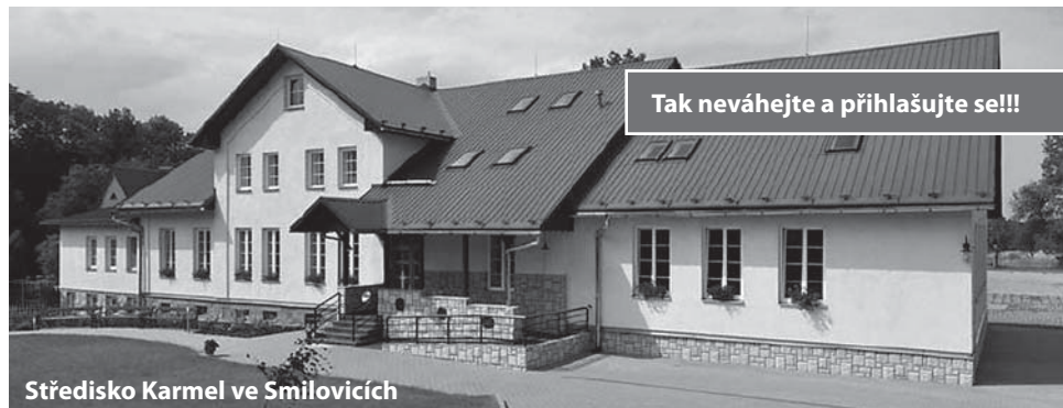
Středisko Karmel ve Smilovicích

nebo zavolat: pevná linka - 556 723 333, mobil - 731 505 939.