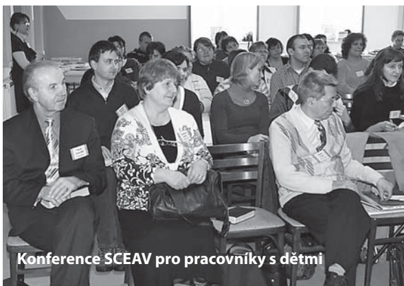
Konference SCEAV pro pracovníky s dětmi