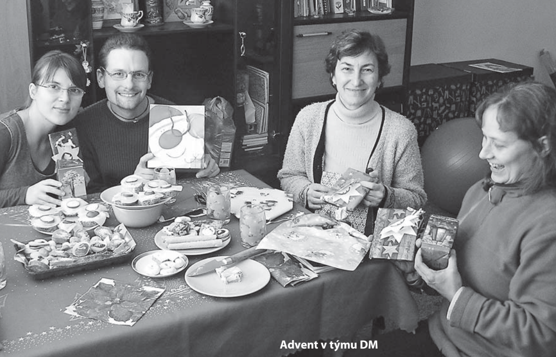
Advent v týmu DM